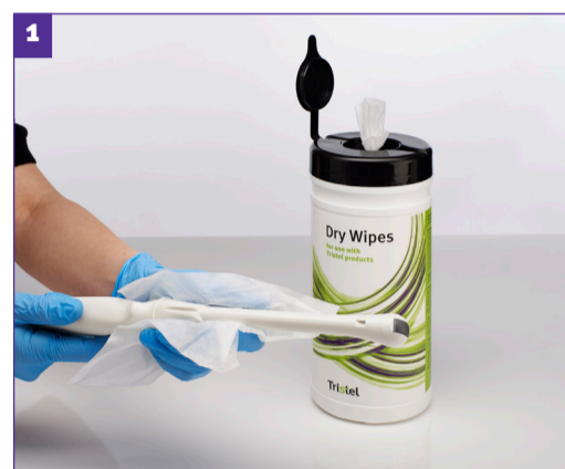
Stap 1 - Voorafgaande aan reiniging, gebruik een Tristel Dry Wipe om gelresten van de sonde te verwijderen.