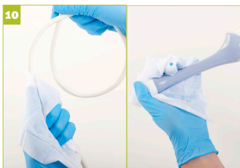
Stap 10 - Spoel de sonde om ontsmettingsmiddel te verwijderen en plaats het terug in de houder.