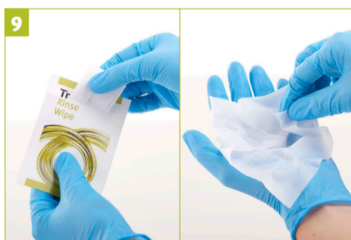
Stap 9 - Verwijder het spoeldoekje uit het zakje en vouw het uit in de palm van de hand.