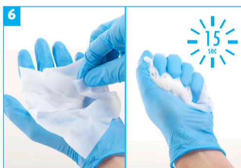
Stap 6 - Vouw het doekje en knijp gedurende 15 seconden om chloordioxide te genereren.

Het gehele doekje dient met schuim bedekt te zijn.