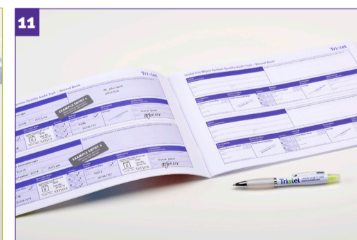
Stap 11 - Verwijs naar de gebruikte zakjes van de Tristel doekjes en het Aktivatorschuim om het Record Book in te vullen.