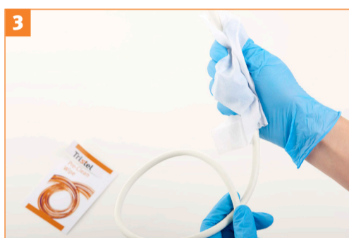
Stap 3 - Reinig de sonde van 'schoon' naar 'niet schoon': begin bij de houder, dan de kabel en werk richting het handvat en uiteinde van de sonde.

Plaats de sonde terug in de houder. Na deze stap, ontsmet handen en draag een nieuw paar handschoenen.