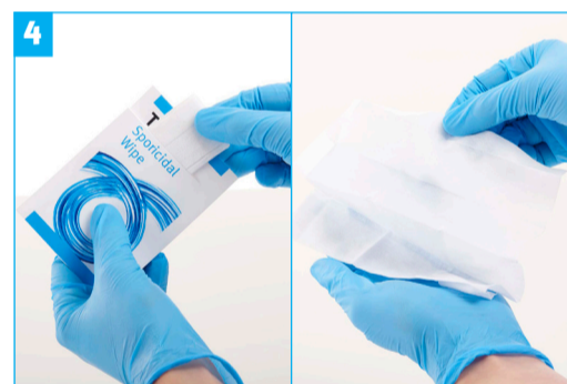
Stap 4 - Verwijder het sporicide doekje het zakje en vouw het uit in de palm van de hand.