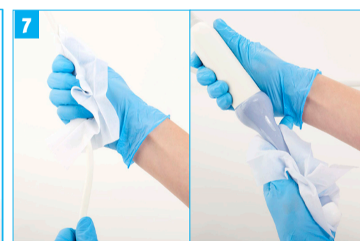
Stap 7 - Ontsmet de sonde van 'schoon' naar 'niet schoon': begin bij de houder, dan de kabel en werk richting het handvat en uiteinde van de sonde. Alle oppervlakken van het instrument dienen tenminste een keer met het doekje in contact te komen.

Het gehele doekje dient met schuim bedekt te zijn.