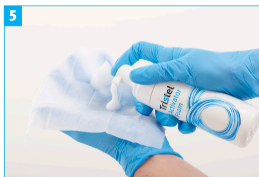
Stap 5 - Breng twee doses Aktivatorschuim aan op het doekje.