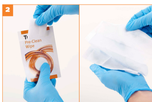
Stap 2 - Verwijder het reinigingsdoekje uit het zakje en vouw het uit in de palm van de hand.